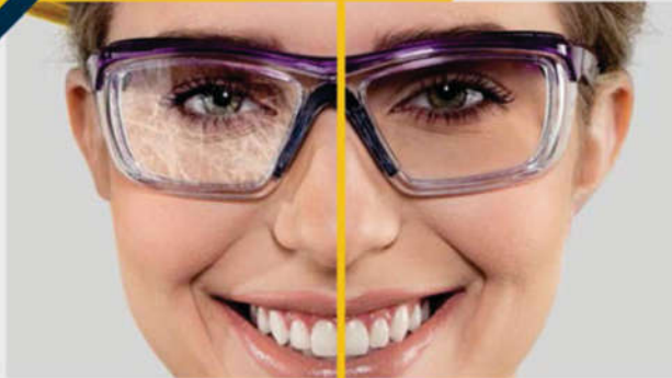
sem tratamento D-Risk | com tratamento D-Risk