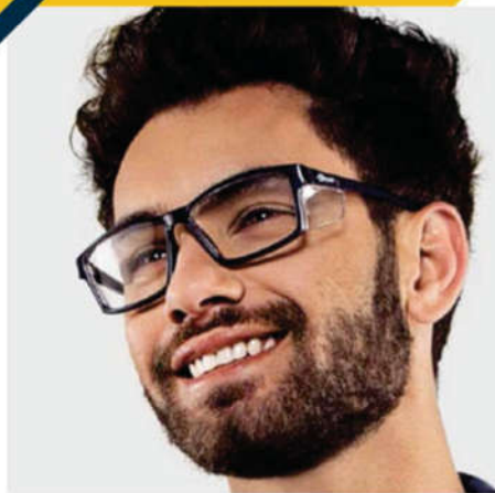
ambiente interno D-Foto