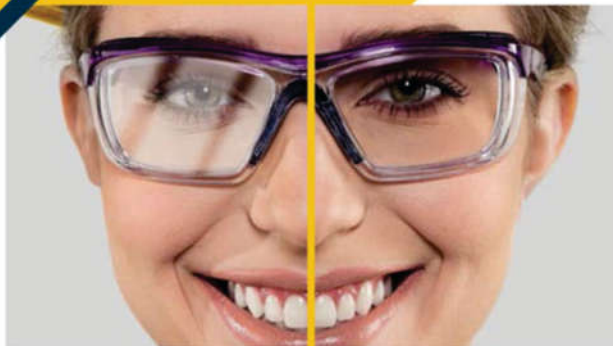
sem tratamento D-Reflex | com tratamento D-Reflex