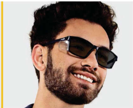
ambiente externo D-Foto